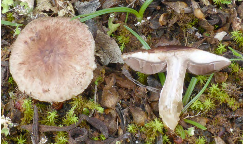
Agaricus comtulus Fr.: carpòfors.